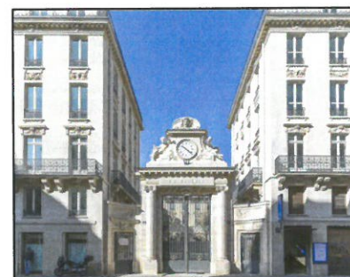
Rénovation d'un immeuble de bureaux Rue Saint Lazare à Paris

RGE : Isolation des murs et planchers bas www.fliipo.fr