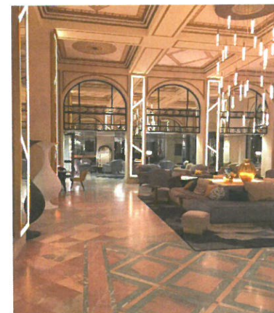
Rénovation Hôtel Hermitage La Baule