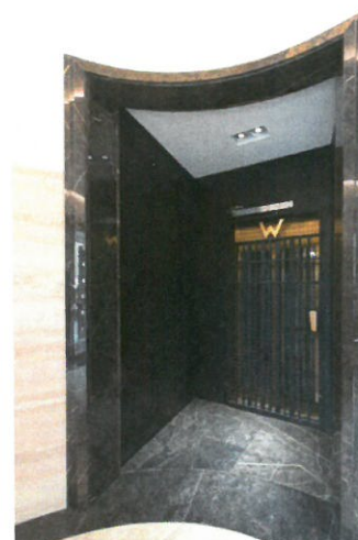
Marbre strié, agrafé et scellé Immeuble Weill Paris